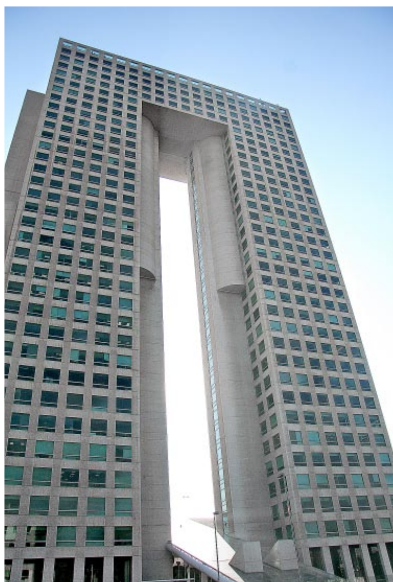
Oficinas corporativas de Pegaso Tecnología.

soluciones@pegasotecnologia.com www.pegasotecnologia.com